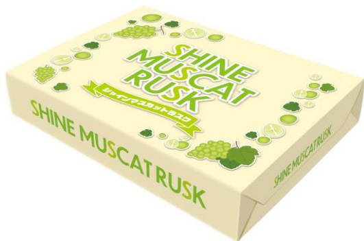
箱タイプ (個包装12枚入)