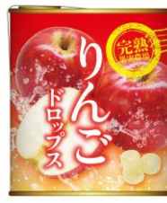
りんごドロップス