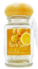
レモン&ジンジャー