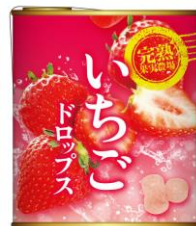
いちごドロップス